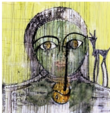
Whistle of unnatural 150x150cm.